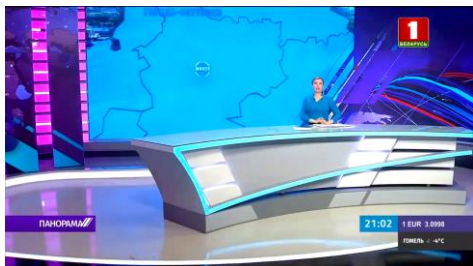
Видео «Застройка городов-спутников в Беларуси: что уже сделано?» (08:20)