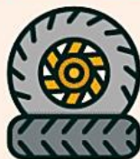
автошины и покрышки